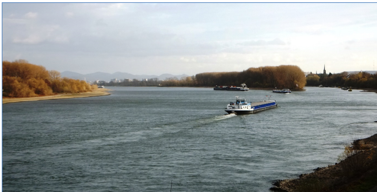
Der Naturpark Rheinland reicht von der Ville bis zum Rhein