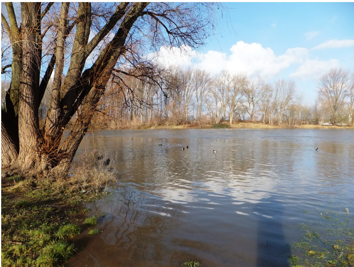
Blick vom Herseler Rheinufer auf das Herseler Werth