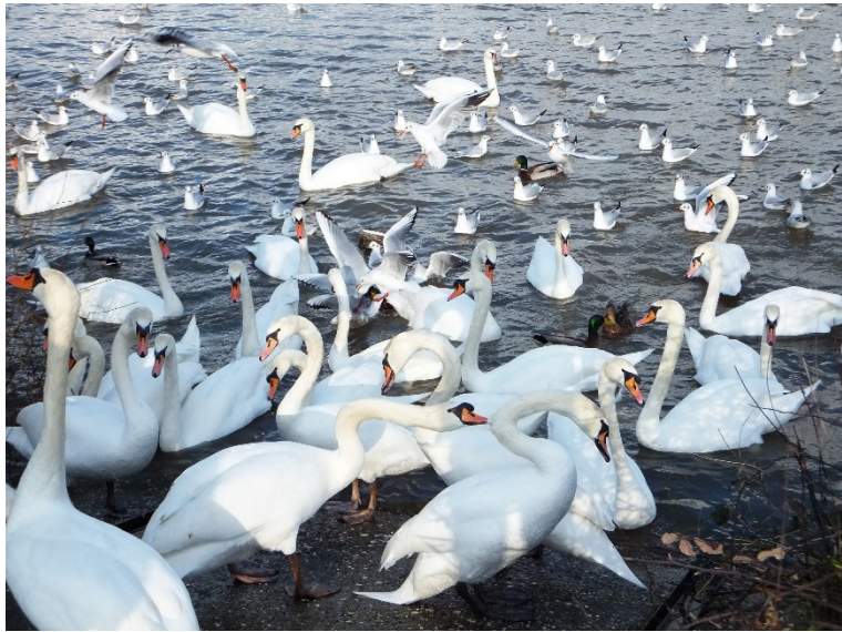
Höckerschwäne, Lachmöwen und Stockenten am Herseler Rheinufer

Auf der Herseler Insel brüten u.a. vom Aussterben bedrohte, auf der Roten Liste stehende Vogelarten wie Nachtigall , Pirol und Schwarzmilan . Hier wurden Eisvögel gesichtet und als Durchzügler Flussuferläufer . Neben häufigen Höckerschwänen , Kanada- und Nilgänsen kann man vom Herseler Rheinufer aus - am besten mit Hilfe eines Fernglases - Lachmöwen , Kormorane und Graureiher beobachten. Neben Stockenten bekommt man mit Glück auch Tafel- , Krick- und Reiherenten und manchmal sogar Gänsesäger zu Gesicht.