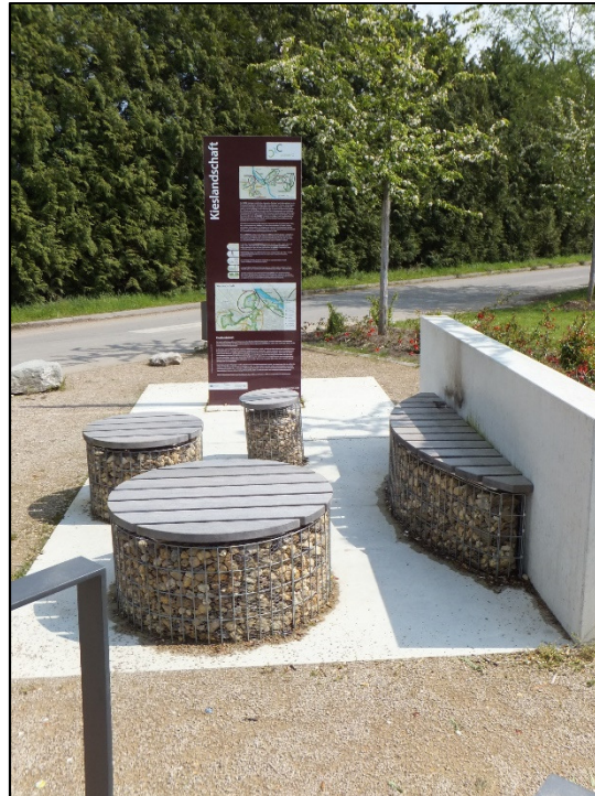
Rastplatz des Grünen C am „Herseler See“

Die Stadt Bornheim setzte die Planungen für ihr Stadtgebiet mittlerweile um. 20 % der Kosten musste die Stadt selbst übernehmen, 80% werden vom Bund, dem Land und von der EU getragen. Die Wege des „Grünen C“ führen von der Mondorfer Fähre aus auf Bornheimer Gebiet nach Hersel, von dort über zwei Strecken nach Roisdorf, dann den Vorgebirgshang hoch in Richtung Heimatblick und anschließend über die Villehöhe zur Villa Rustica in Botzdorf. Diese Ausgrabung eines ländlichen Anwesens aus der Römerzeit ist seit 2014 für die Öffentlichkeit zugänglich. Der Schutzbau über dem antiken Denkmal und der Zugang von der Aeltersgasse sowie Info-tafel und Sitzbänke wurden als Einzelmaßnahme des „Grünen C“ gefördert.