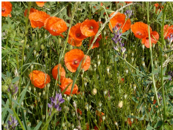
Blühstreifen wie hier der Klatschmohn verschönern Wegesränder

Ein Grünzug in Form eines „C“ verbindet vom Vorgebirge bis über den Rhein hinweg die sechs Kommunen Bornheim, Alfter, Bonn, Niederkassel, Troisdorf und Sankt Augustin. Dieses „Grüne C“ sichert langfristig die verbliebenen Freiräume in der Landschaft. Damit wird einer weiteren Zersiedlung unserer Natur- und Kulturlandschaft entgegen gewirkt. Ziel ist u.a. die Förderung einer ruhigen und landschaftsbezogenen Nah- und Regionalerholung .