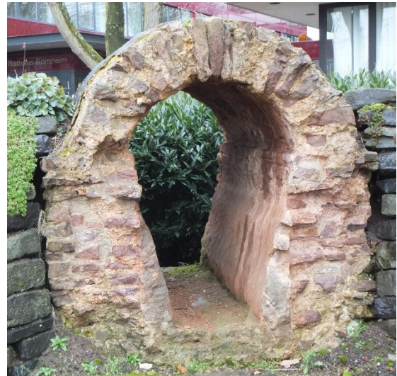
Stück des Römerkanals vor dem Bornheimer Rathaus

Auf gutes Trinkwasser legten die Römer großen Wert. Um 50 n.Chr. entstand „Colonia Claudia Ara Agrippinensium“ (Köln) als städtisches Oberzentrum am Niederrhein. Um 80 n.Chr. errichteten die Römer zur Versorgung der Einwohner des antiken Kölns ein technisches Meisterwerk : Den Römerkanal.