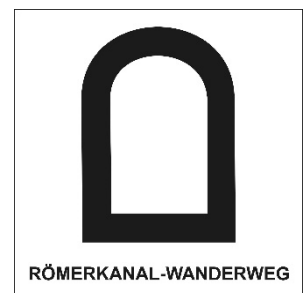
Logo des „Römerkanal-Wanderweges“

Die Leitung durchquert das Bornheimer Stadtgebiet von Buschhoven kommend in Richtung Brühl und berührt dabei Waldorf, Kardorf und Walberberg. Der Römerkanal-Wanderweg von Nettersheim nach Köln entlang der Trasse dieser historischen Wasserleitung führt so auch über Bornheimer Stadtgebiet ( www.roemerkanal-wanderweg.de ).