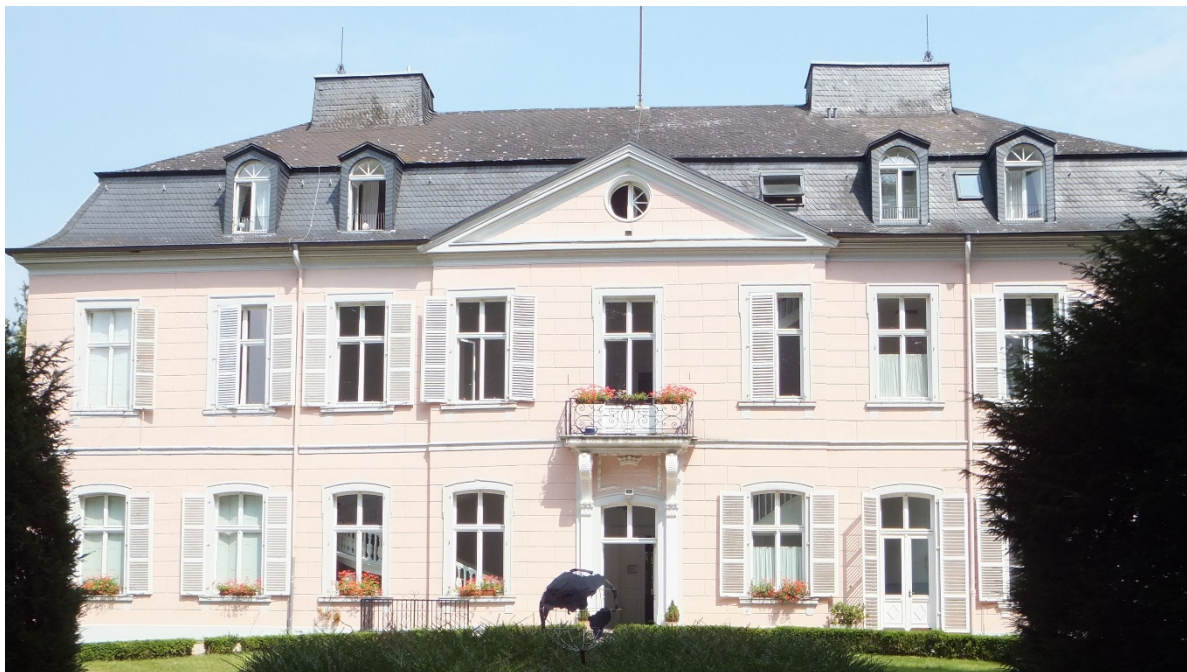
Das barocke Schloss Bornheim