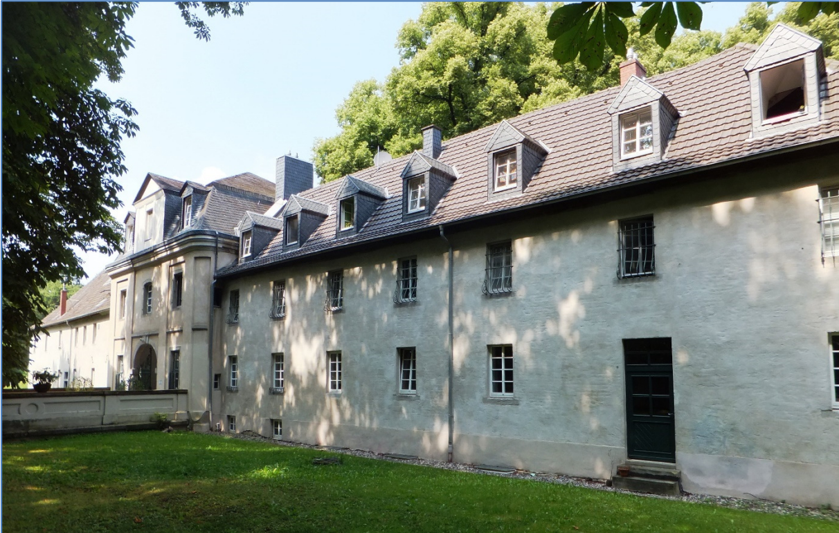
Vorburg mit verlandetem Wassergraben

Heimatsforscher sehen in der Architektur des Barock-Schlusses und des Einfahrtsbogens deutliche Hinweise auf das Wirken des westfälischen Barockbaumeisters Johann Conrad Schlaun. Horst Bursch verweist zudem auf die angesehene Stellung des Freiherrn von Waldbott am kurfürstlichen Hof. Dieser „stand dem Kurfürsten besonders nahe, so dass mit Blick auf das Jahr 1728, dem Baubeginn von Schloss Bornheim, es keineswegs abwegig erscheint, Schlaun als Baumeister zu vermuten. Denn 1728 wurde er ja von der Bauleitung in Brühl entpflichtet“ (Horst Bursch 1995).