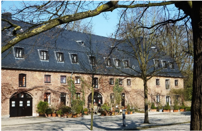
Ein Blick in den Ehrenhof – früher Wirtschaftsgebäude, heute Wohnanlage

– eindeutig als Überraschungsmoment ausgedacht – das Schloss auf einer Terrasse hoch über der Rheinebene schwebend (Doepgen/Günter 1978).