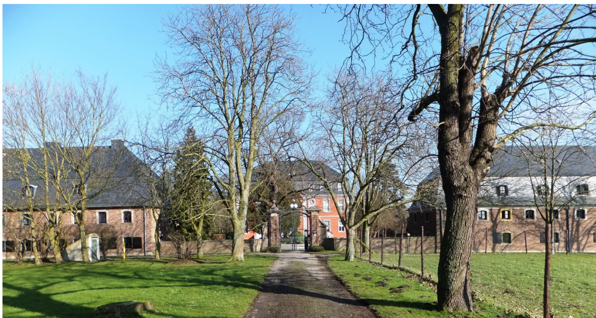
Gebäude- und Mauerfront des Schlosses Rösberg