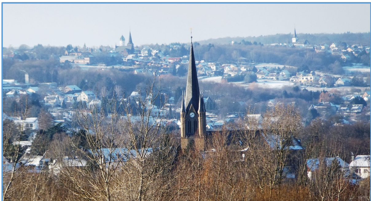
Blick vom LSV-Turm aufs Vorgebirge über Brenig nach Rösberg