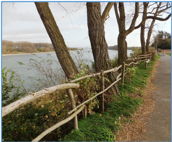
Spaziergänger lieben das Rheinufer bei Widdig

Zur Stadt gehören 14 Ortschaften . Entlang des Osthangs der Ville, dem Vorgebirge , reihen sich 10 dieser Orte als fast geschlossenes Siedlungsband von der Alfterer Gemeindegrenze im Südosten bis hin zur Brühler Stadtgrenze im Nordwesten. Am südlichsten liegt Roisdorf mit 6.000 Einwohnern. In nordwestlicher Richtung folgen Bornheim (8.250 E.), Brenig (2.300 E.), Dersdorf (1.200 E.), Waldorf (3.300 E.), Hemmerich (1.500 E.), Kardorf (1.850 E.), Rösberg (1.450 E.), Merten (5.550 E.) und schließlich Walberberg (4.850 E.). In der