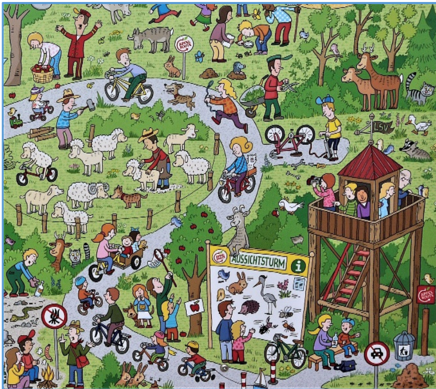
Wimmelbild am LSV-Aussichtsturm.

Die Rheinische Apfelroute der Rhein-Voreifel-Touristik verläuft durch das größte Obst- und Gemüseanbaugebiet NRWs ( www.apfelroute.nrw ). Auch die Schleife Bornheim dieses Radwanderwegs bietet besondere Höhepunkte. Der Rundkurs mit einer Fahrtzeit von ca. fünf Stunden führt durch freie Landschaft und entlang oder durch die Ortschaften Roisdorf, Botzdorf, Brenig, Dersdorf, Waldorf, Kardorf, Rösberg, Merten, Walberberg, Sechtem, Bornheim, Uedorf und Hersel. Die Schleife Bornheim verbindet so das Vorgebirge mit dem Rhein.