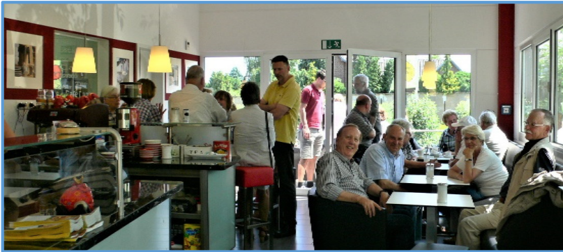
Apfelcafé im Obstbaubetrieb Schmitz-Hübsch

Pausen einlegen, frisches Obst, Gemüse, Ziegenkäse sowie Wein einkaufen und genießen oder eine Baumschule besuchen, kann man auch bei den folgenden Apfelrouten-Partnern entlang der Schleife Bornheim: Biolandhof Apfelbacher (Karte: Grüner Kreis 2) in