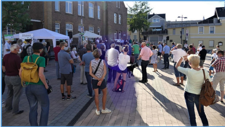
Podiumsdiskussion in Bornheim auf dem Peter-Fryns-Platz zur Kommunalwahl 2020

Wir wollen, dass Bornheim die Klimathematik höchste Priorität einräumt. Als Vorreiter könnte unsere Kommune wichtige Pionierarbeit leisten und so Vorbild für andere Städte und Gemeinden werden, sowie sich einen wirtschaftlichen Vorsprung verschaffen. Dazu haben wir bereits zu Podiumsdiskussionen, Protesten und Demonstrationen eingeladen und waren mit lokalen Parteien und Politiker*innen im Gespräch.